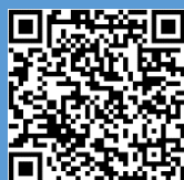
講習会申込ページ